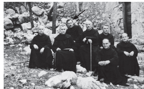
Čerigaj, župa Široki Brijeg, 15.5.1944.

Pastoralno je djelovao kao kapelan na Širokom Brijegu (1922.-1925.), a potom je u istom samostanu bio vikar (1925.-1928.), te gvardijan i župnik (1928.-1931.). Potom je bio župnik u Tihaljini (1931.-1933.) i Gorici (1933.-1934.), te devet godina tajnik i ekonom Provincije u Mostaru (1934.-1943.). Definitor Provincije od 1943. i na kraju župnik u Čapljini od 1943. do mučeničke smrti 1945.