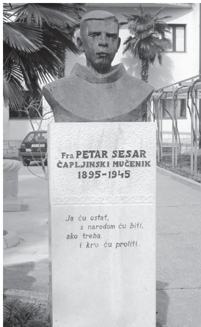
Bista fra Petra nalazi se pored crkve u Čapljini

katolika, početkom veljače 1945. odveli iz župne kuće u Čapljini preko Neretve i ubili na nepoznatom mjestu, u blizini Domanovića. To se dogodilo 4. veljače 1945. Ljudi su vidjeli kako ga partizani kundacima udaraju po glavi i odvođe sa sobom preko Neretve, te ga okrvavljenog i vezanog žicom odvođe na strijeljanje. To se dogodilo negdje između Čapljine i Domanovića. Ubijen je oko 6. veljače 1945. u 50. godini života, 31. godini redovništva i 24. godini svećeništva.